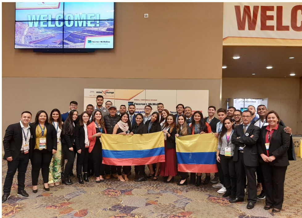
Ilustración 1 encuentro SME